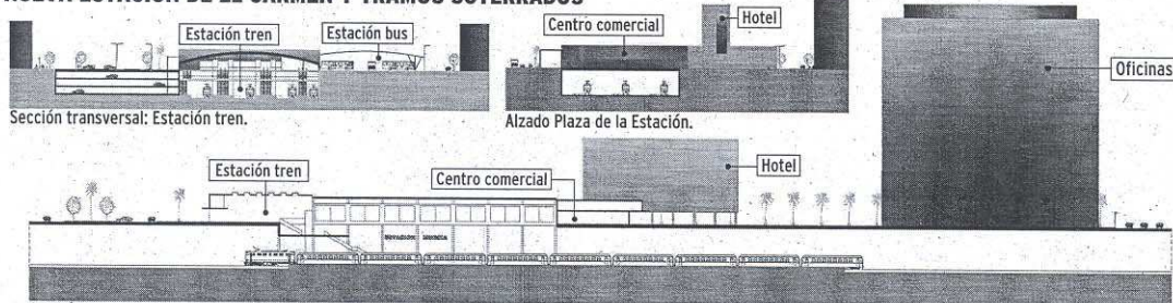
Sección transversal: Estación tren.